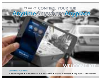
bwa™ - Kit de bienvenue