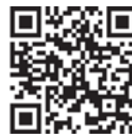
À bwa page web