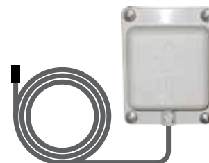
bwa™ Module Wi-Fi (50350)