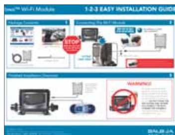
1-2-3 Guide pour une installation facile