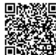
BWA de vidéos sur YouTube